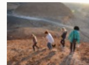
Kleine Wanderung in der Wüste