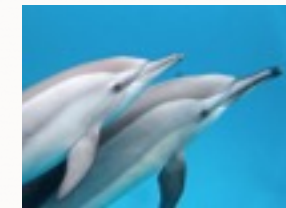
Die Chance Spinnerdelfine zu sehen