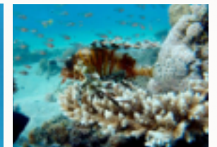
Korallenriff mit Löwenfisch